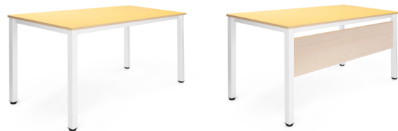
opcja z blendą