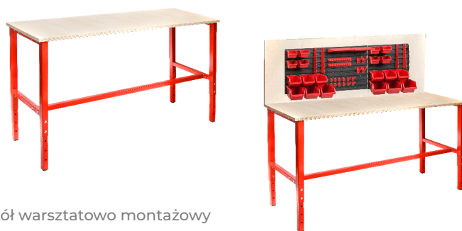
stół warsztatowo montażowy